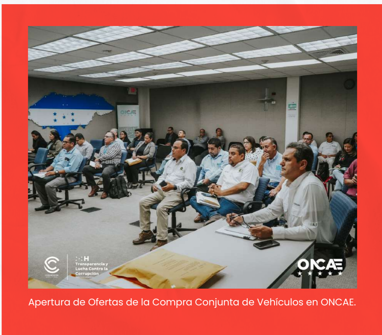
Apertura de Ofertas de la Compra Conjunta de Vehículos en ONCAE.