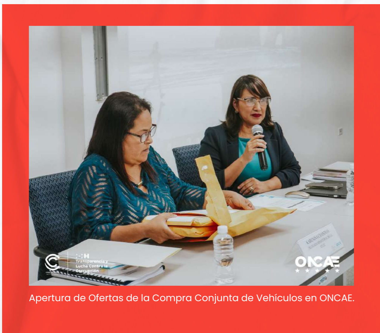
Apertura de Ofertas de la Compra Conjunta de Vehículos en ONCAE.

En el marco del control interno desde la ONCAE, se promueve la contratación mediante la compra conjunta donde se establece el procedimiento y mecanismo de compra eficiente, ágil y transparente para el sector público.